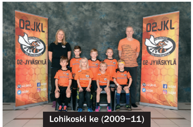
Lohikoski ke (2009-11)