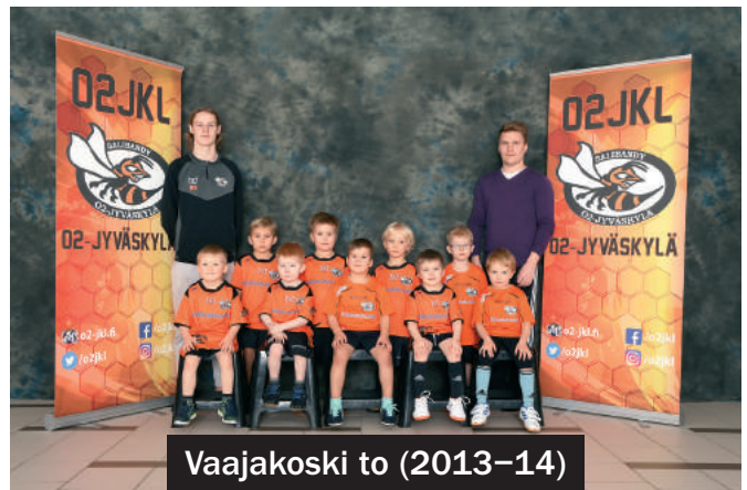
Vaajakoski to (2013–14)