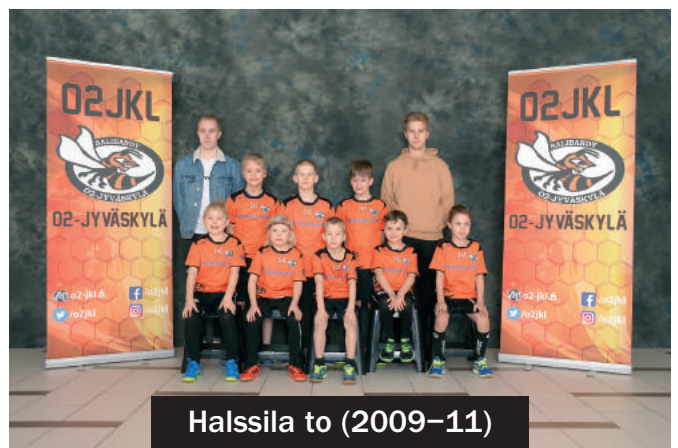
Halssila to (2009-11)