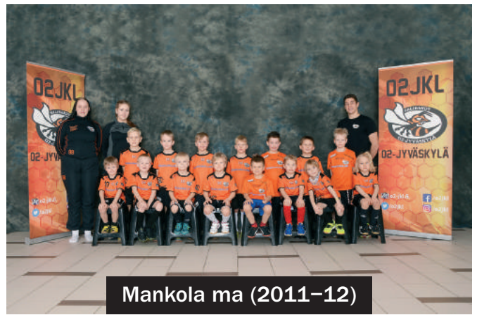
Mankola ma (2011-12)