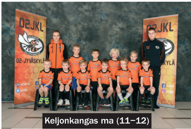
Keljonkangas ma (11-12)