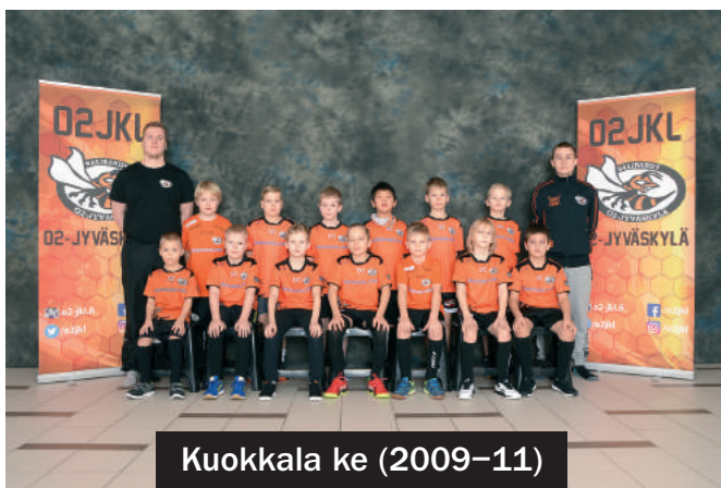
Kuokkala ke (2009-11)