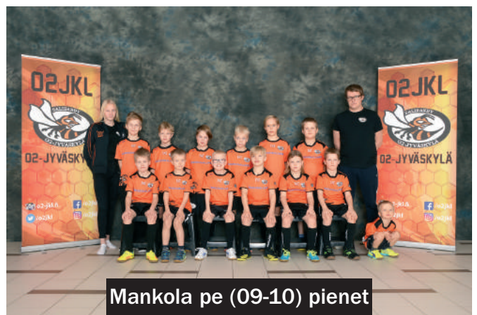
Mankola pe (09-10) pienet