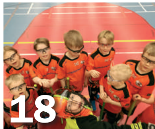
Talent Cup on jo perinteinen kevään suurturnaus.