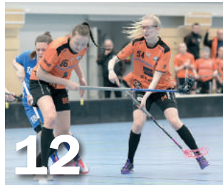
Naiset palasivat ryminällä Salibandyliigaan.