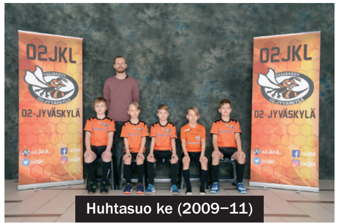
Huhtasuo ke (2009-11)