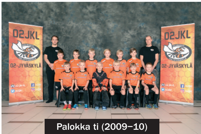
Palokka ti (2009–10)