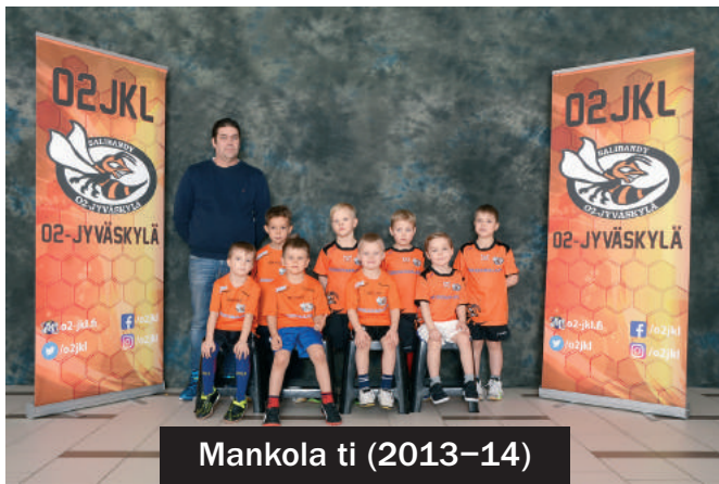
Mankola ti (2013–14)