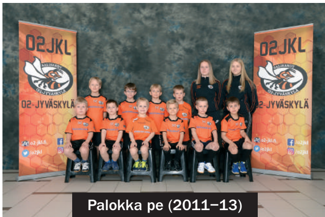
Palokka pe (2011–13)