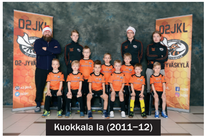
Kuokkala la (2011-12)