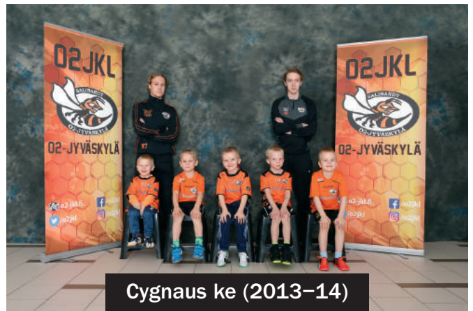
Cygnus ke (2013-14)