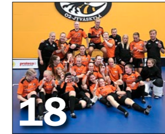
Tyttö Akatemian pelaajilla riittää haasteita ja pelejä