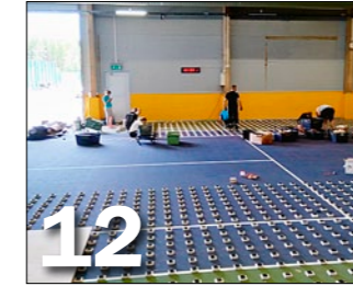
Ampparipesällä paiskottiin tuhansia talkootunteja