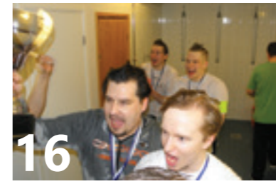
16 Miesten Suomen Cup päättyi jyväskyläläisten juhliin.