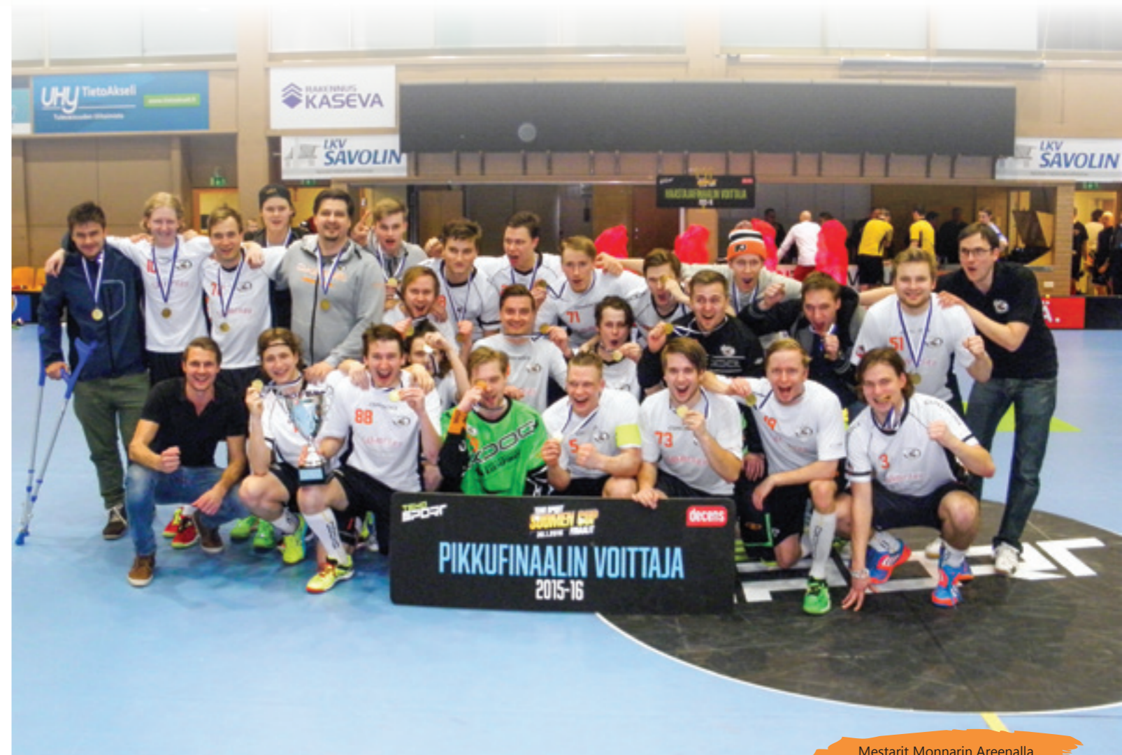
Mestarit Monnarin Areenalla.

Ennen yhtään suurta voittoa pitää olla joukkue. Sellainen meillä on. Joukkue. ●