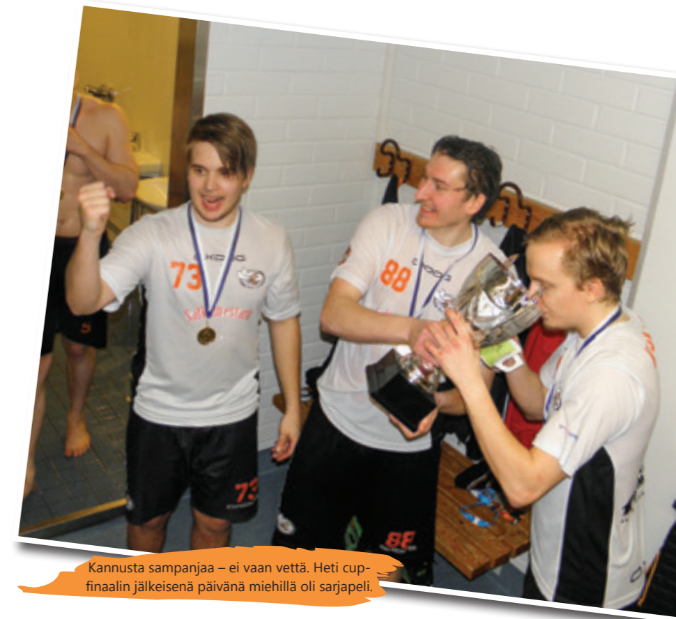
Kannusta sampanjaa – ei vaan vettä. Heti cup-finaalin jälkeisenä päivänä miehillä oli sarjapeli.

Cup-taipaleemme jälkeen ymmärrän sanonnan ”matka on tärkeämpi kuin päämäärä” merkityksen. Pikkufinaalin voitto oli makea kirsikka kakussa.