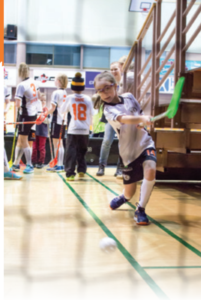
Kevään derbyssä Happeeta vastaan nähtiin rajua vääntöä ja Ampparien kannalta onnellinen loppu. Pikku-Ampparit pääsivät testaamaan laukaisutaitojaan ottelun tauoilla.

Jyväskylä on käynyt tutuksi muualtakin tulleille pelaajille, vaikkei se aina helppoa ole ollutkaan. Ilmeisesti Jyväskylässä kaikki tiet eivät aina vie haluttuun paikkaan ja parkkeeraus on vaikeampaa, sillä sen verran usein on lyhyelläkin matkalla eksytty, auto on ollut väärässä paikassa tai jopa valunut väärään paikkaan! Muutaman joukkueemme pelaajan kannattaa jatkossa kehittää myös tasapainoa, sillä sen verran haastavaa on ollut pysyä ja-