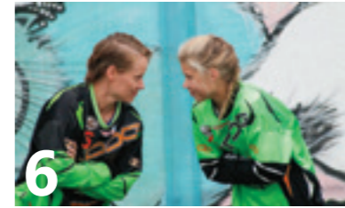
6 O2-Jyväskylän naisilla on mielenkiintoinen maalivahtikaksikko.