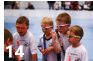
14 Amppariliigassa surisee jo lähes 400 "pikkuherhiläistä".